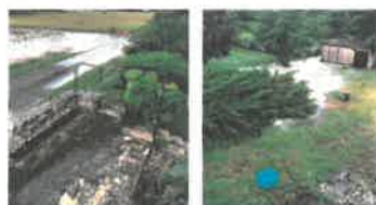
Le Pech (VC 7, communautaire)