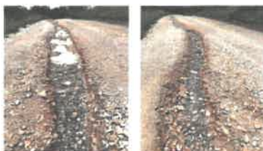
Chemin de Sagnet (CR communal)